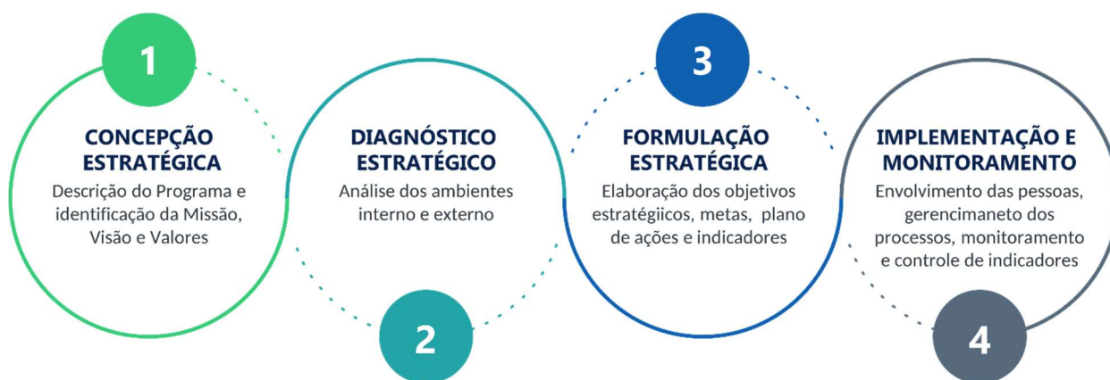
Figura 1: Processo de Planejamento Estratégico do PGEAGRI

Neste PE, são apresentados: (1) a descrição do Programa; (2) a concepção estratégica com a definição da missão, visão e valores do Programa; (3) o diagnóstico estratégico com as análises dos ambientes interno e externo com uso da ferramenta Análise SWOT; e (4) a formulação estratégica contemplando a descrição dos objetivos operacionais e metas; dos objetivos estratégicos, metas, indicadores direcionadores e indicadores de resultado, com apresentação do plano de ação resumido.