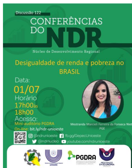
Figura 1 – Modelo do convite divulgado nas mídias sociais

Até o momento, foram realizadas 122 Conferências do NDR, com apresentadores incluindo docentes, discentes e egressos da Unioeste, bem como docentes de outras instituições. O evento começa com um convite antecipado ao conferencista, seguido pela criação de um modelo de convite a ser divulgado nas mídias sociais.